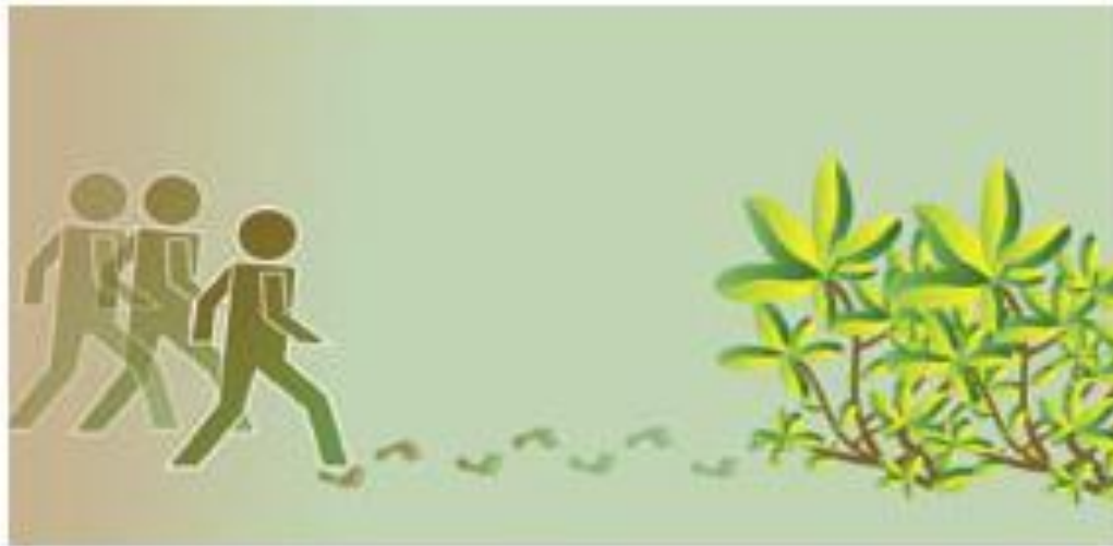
Figura 1 Enfoque tradicional de la relación entre ambiente y migración