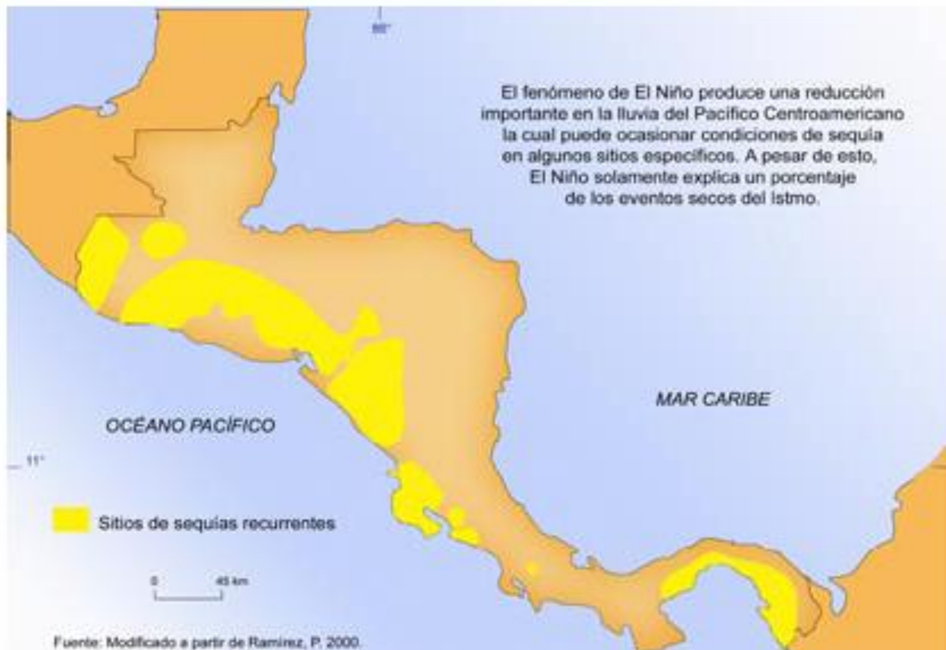
Mapa 2. Áreas propensas a sequías en Centroamérica