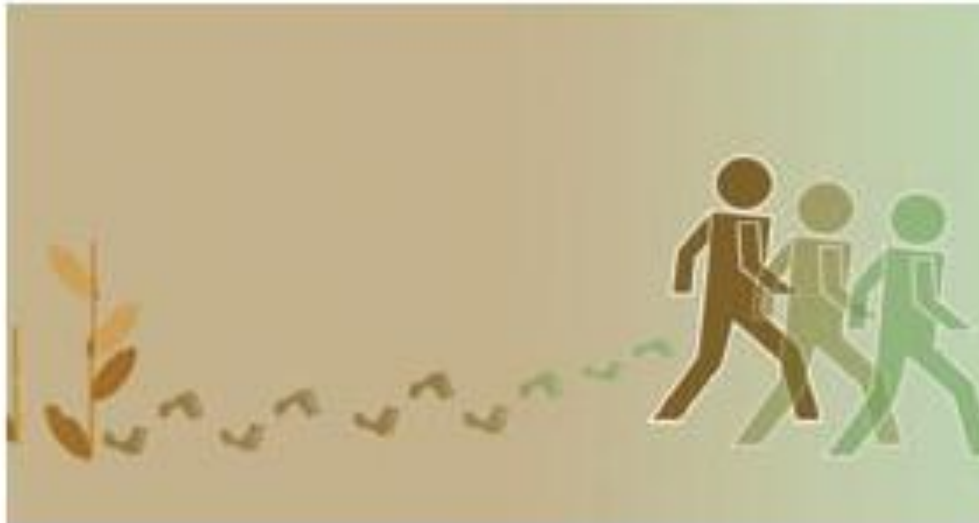
Figura 2 Enfoque novedoso de la relación entre ambiente y migración